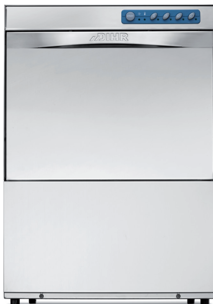
GS 50 - GS 50 T