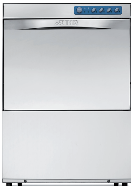
GS 50 ECO