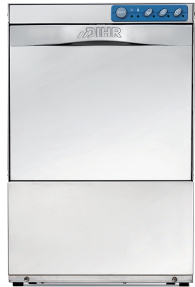
GS 40 - GS 40T